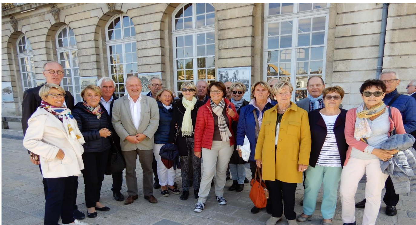
Nancy , Place Stanislas devant l'Hôtel de ville

A l'initiative de l'AGLIF, cette visite guidée de 2 jours à Nancy a constitué le deuxième volet de la découverte de l'art nouveau. Elle a rassemblé 20 amis Lions, passionnés par ce thème.