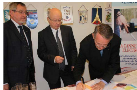
Signature de la convention District IdF Paris et l'Association AGIR

Rappelons que les Districts IdF Paris, Centre-Sud et Sud Est ont fait de la Canne Blanche Electronique leur œuvre de