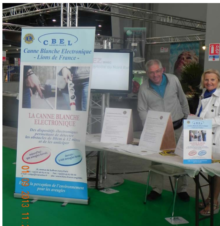
Foire de Chalons-en-Champagne