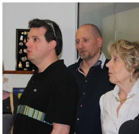
Remerciements d'un aveugle pour la Canne Blanche Electronique au siège du District de Paris

désireux de s'équiper de ces nouveaux outils en suivant une formation de quinze jours, ceci pour pouvoir utiliser correctement la Canne Blanche Electronique ou Optronique (marques déposées à l'INPI en juin 2012)». Ces clubs ont activement participé à la collecte de fonds dont plus de la moitié proviennent de leurs œuvres. Les dons des Lions ont représenté la moitié de ces sommes, l'autre moitié étant en provenance d'organismes privés comme les Fondations, les Caisses