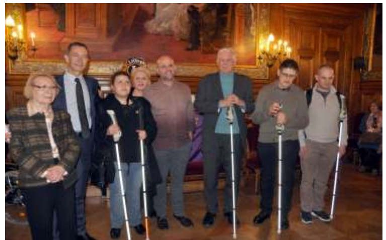
Les membres de Paris Buttes Chaumont, Monsieur le Maire, le moniteur des cannes et les 4 récipiendaires.