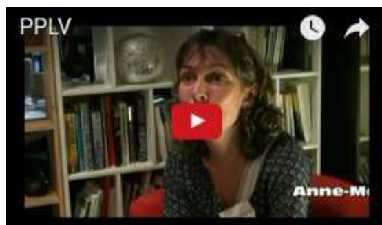
Témoignages de parents et d'éducateurs