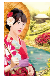
REF 3 (format 21 x 15)