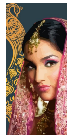
REF 8 (format 20 x 10)