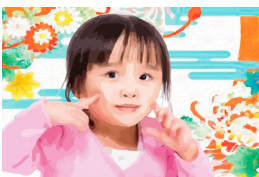
REF 6 (format 21 x 15)