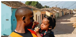
REF 4 (format 20 x 10)