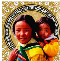
REF 2 (format 16 x 16)