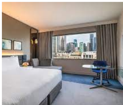
HÔTEL CROWNE PLAZA